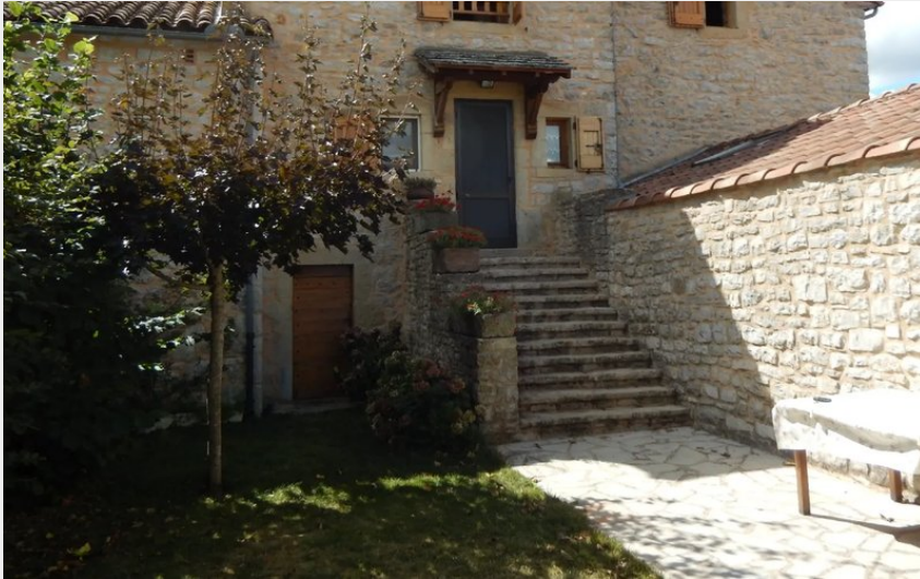
Crédit : La Cardabelle - AYG8010 (OFFICE DE TOURISME LARZAC VALLEES)