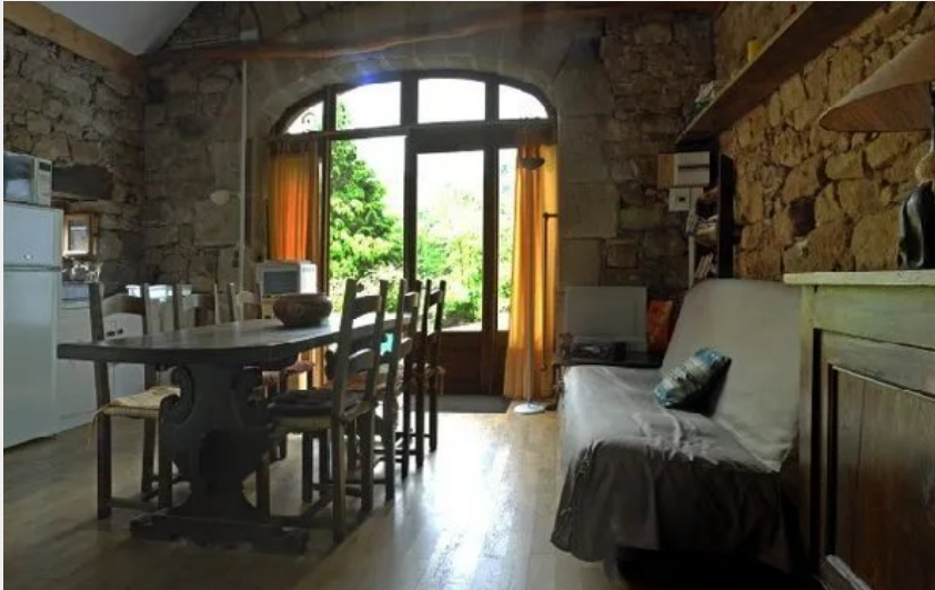
Crédit : Pièce de vie Gîte La Melière (OFFICE DE TOURISME DE PARELOUP LEVEZOU)