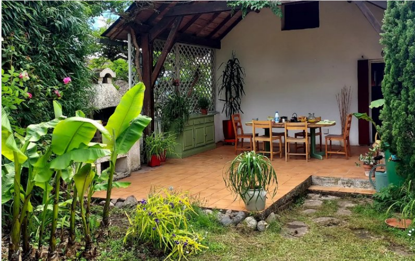
Crédit : Les volets rouges (Office de Tourisme des Causses à l'Aubrac)