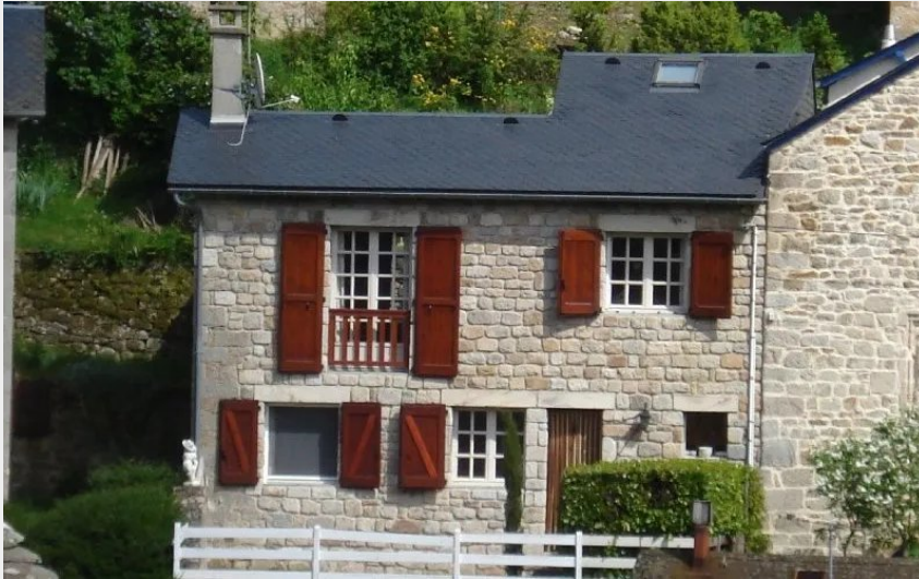
Crédit : Mme Véronique Lafon location Saint Léons (Mme Véronique Lafon)