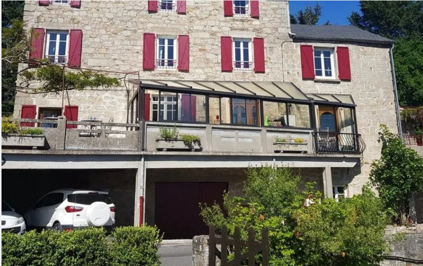
Crédit : La pierre pointue (OFFICE DE TOURISME DE PARELOUP LEVEZOU)