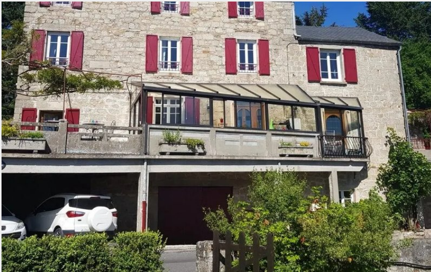
Crédit : La pierre pointue (OFFICE DE TOURISME DE PARELOUP LEVEZOU)