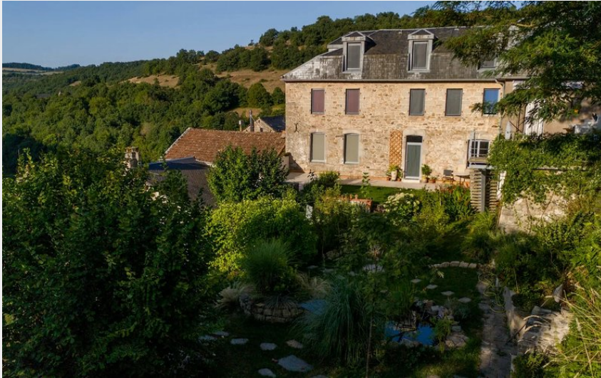
Crédit : Vue Extérieure et Jardin