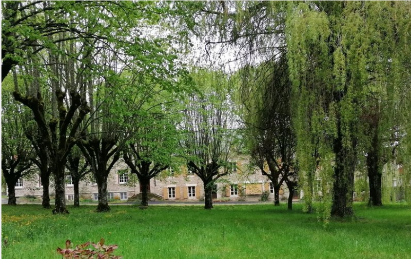
Crédit : Le refuge de Lenne (Office de Tourisme des Causses à l'Aubrac)