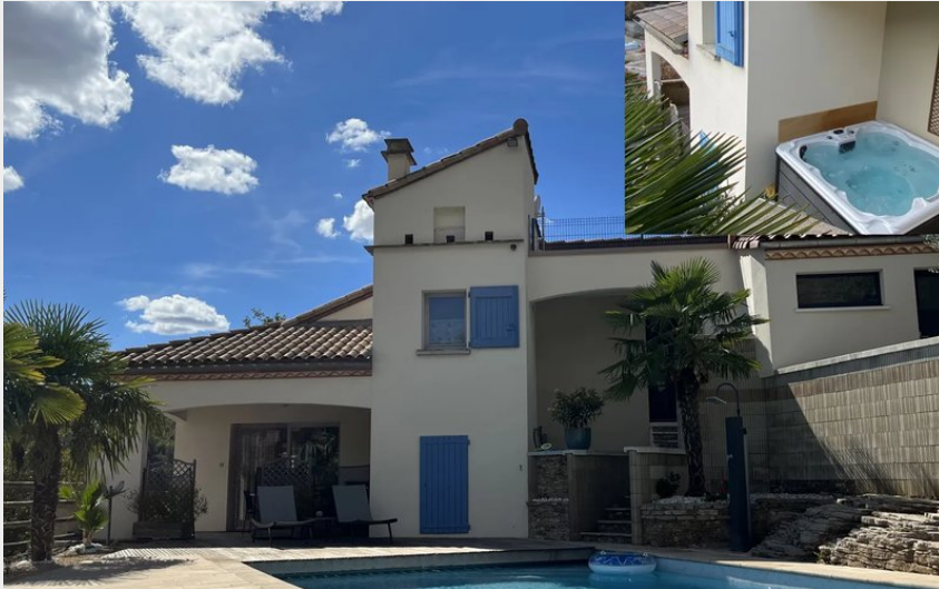
Crédit : Piscine (OFFICE TOURISME DU PAYS DE LA MUSE ET RASPES DU TARN)