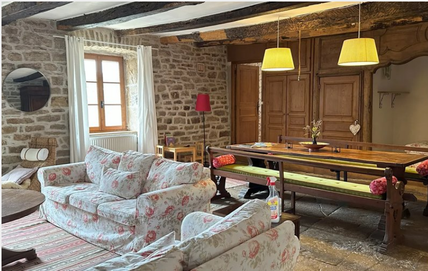
Crédit : Séjour spacieux