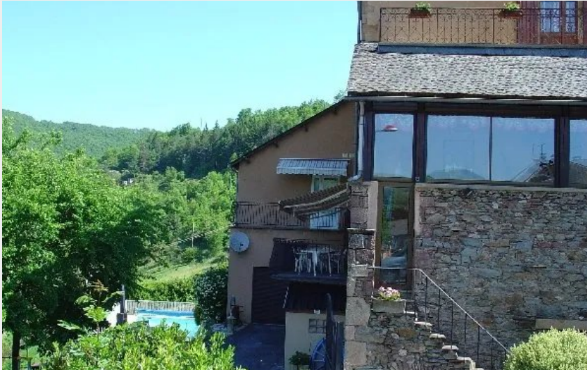
Crédit : Vu extérieure de la maison avec piscine (Mme Andrée VILLENEUVE)