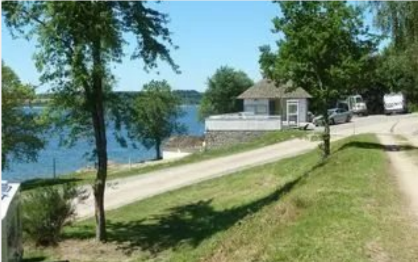
Aire de camping-car