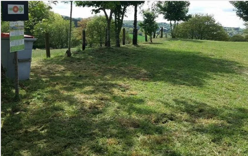
Aire de camping-car au Mas d'Herens