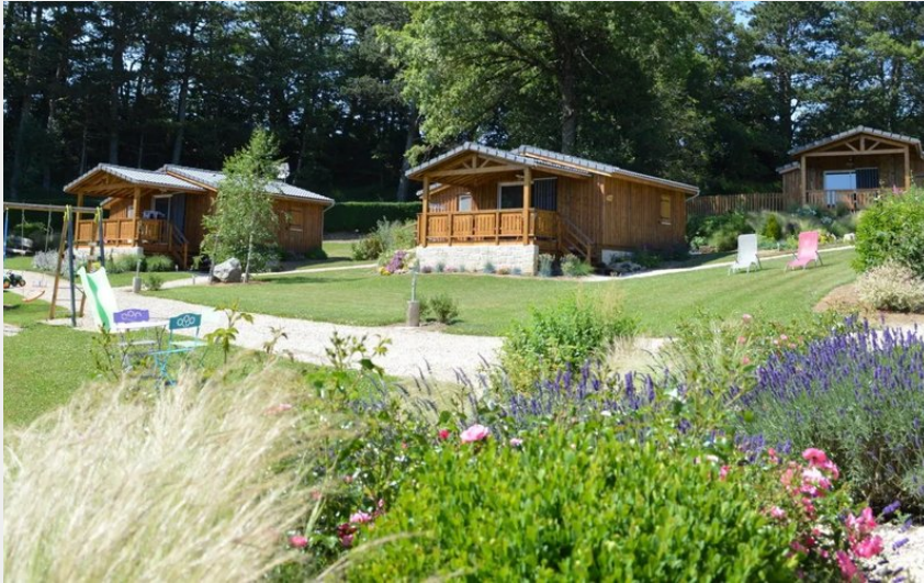
Crédit : Jardin de chalets- Les 3 chalets et le jardin