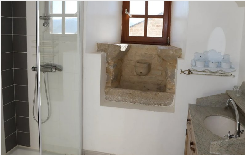
Crédit : La Grange de Saint Grégoire - H12G006082 (La Maison de Saint-Grégoire)