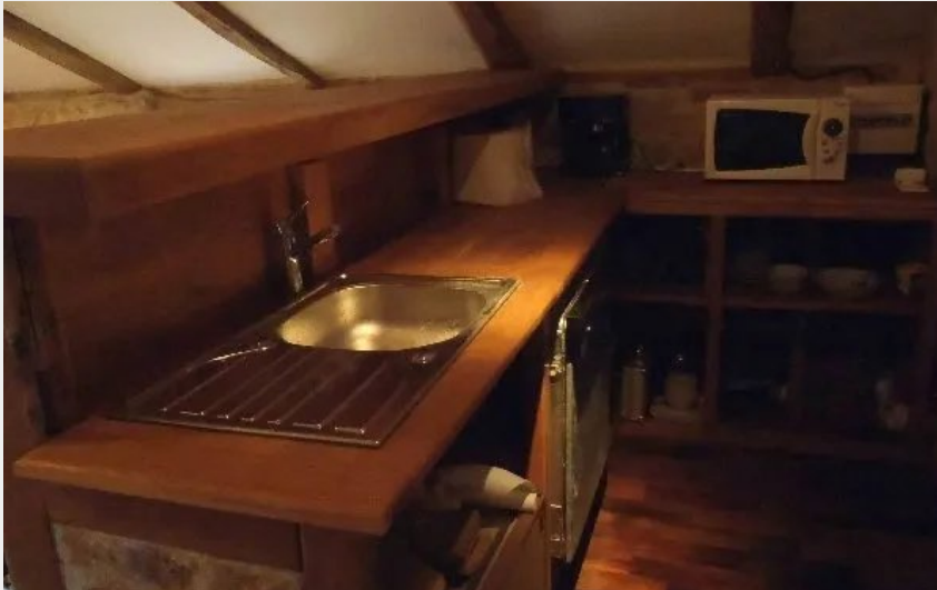
La Grange de Courry