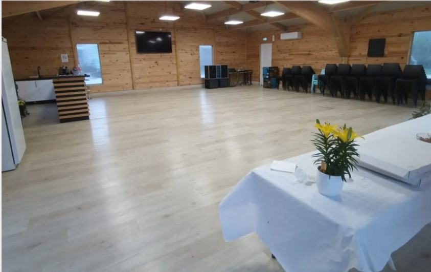
Crédit : Salle de réception