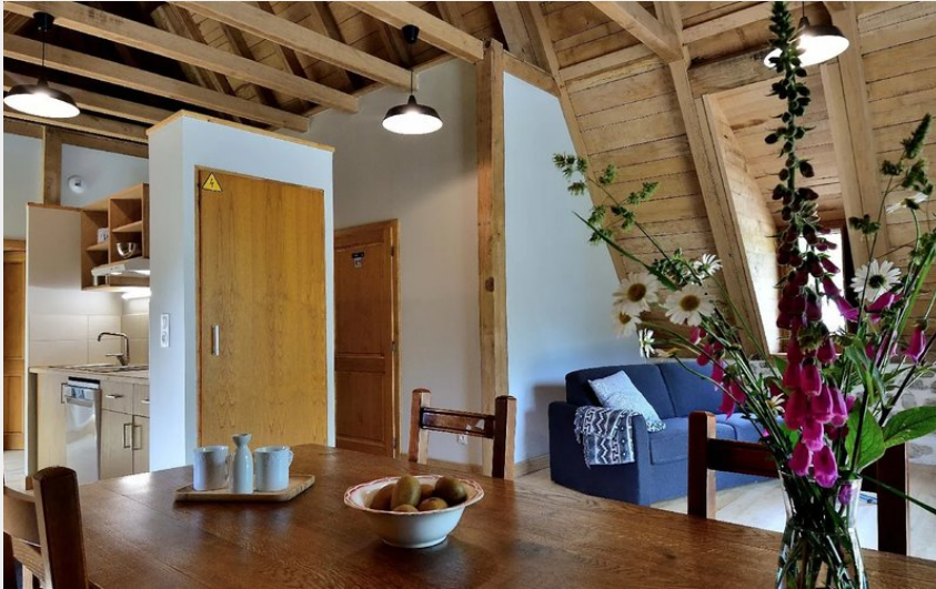
Crédit : La Grange de Manhaval (OFFICE DE TOURISME DU CANTON DE MUR DE BARREZ)