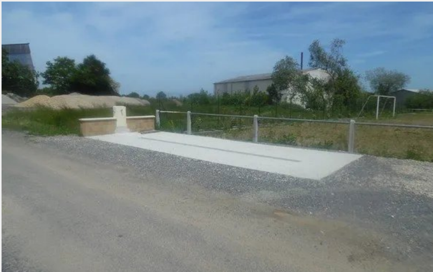
Crédit : Aire de camping car municipale (OFFICE DE TOURISME DE PARELOUP LEVEZOU)