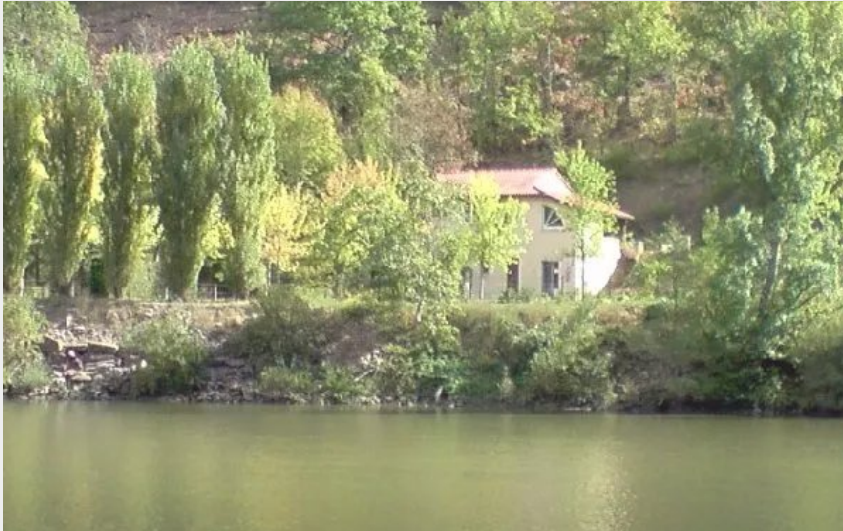
Gîte d'étape paisible en bordure du Tarn