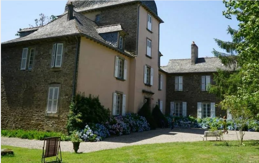
Crédit : Château de Linars - La Forge (Château de Linars - L'aile du château)