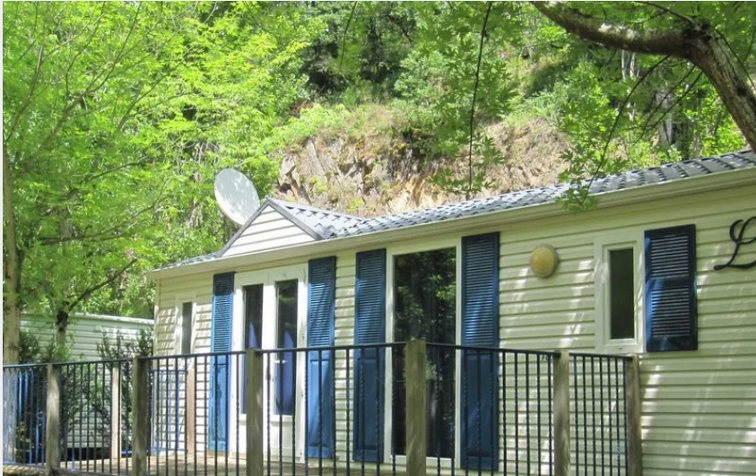
Crédit : Mobile-home 2 chambres Camping de la Prade (Camping Municipal La Prade)