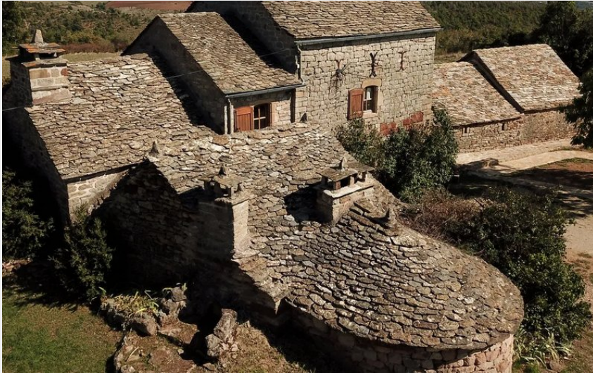
Crédit : vue d'ensemble