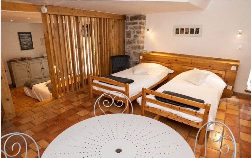
Crédit : Le Pailler - Chambre d'hôte (OFFICE TOURISME DU PAYS DE LA MUSE ET RASPES DU TARN)