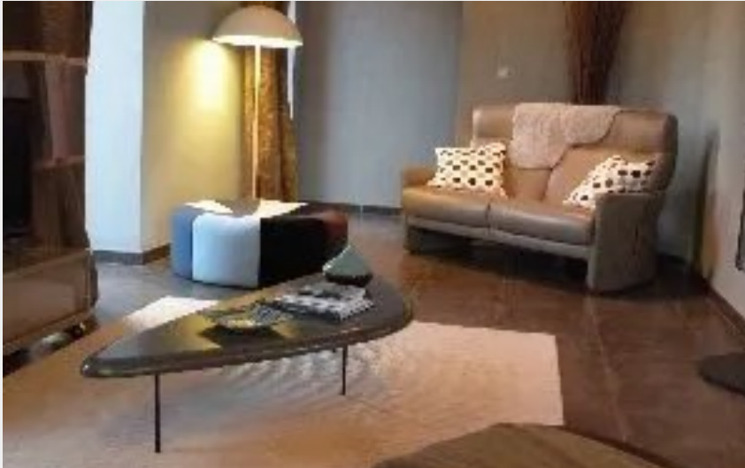
Crédit : Meublé "La Bergerie Baroque"-M ARGUEL JC (OFFICE DE TOURISME DE SEVERAC LE CHATEAU)