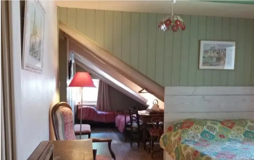
Crédit : Chambre familiale Mélèze (Domaine d'Angel Berg-Gîte d'étape)