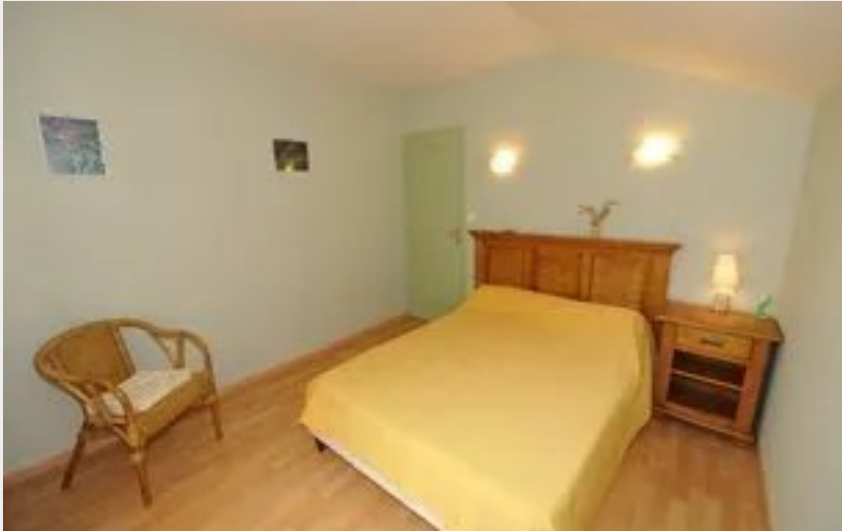
Crédit : Le Noyer (OFFICE DE TOURISME LARZAC TEMPLIER CAUSSES ET VALLEES)