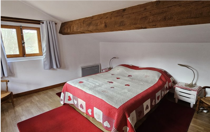
Crédit : 1 gîte de l'olivette 02 2024 1