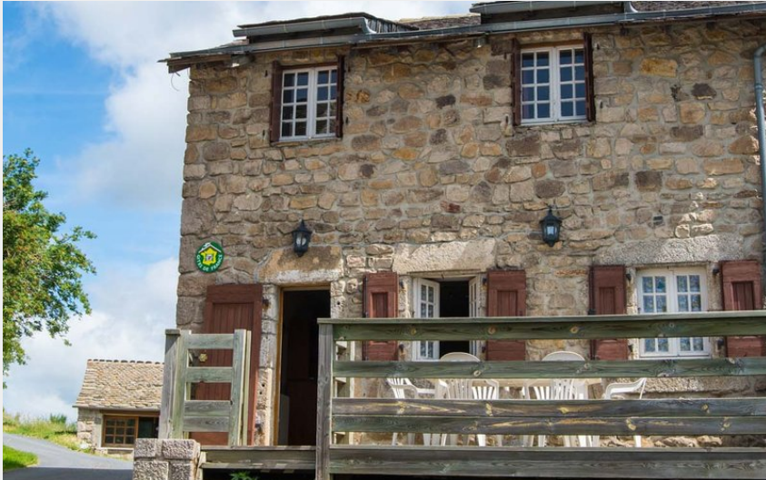
Crédit : Gîte Grand Vincent - parc des loups - sainte-lucie - lozere (1) (Parc Les loups du gévaudan)