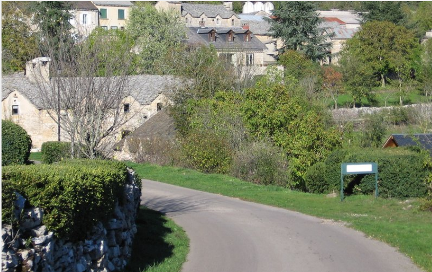
Crédit : La Planquette, Gîtes de Combelasais - Le village (La Planquette, Gîtes de Combelasais)