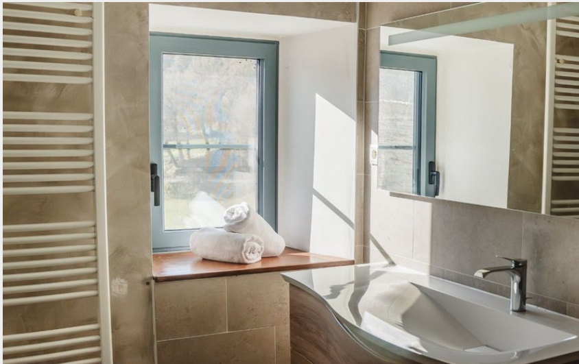
Crédit : Salle de bain de la chambre double - Maison Caussearde (Domaine de La Vialette)