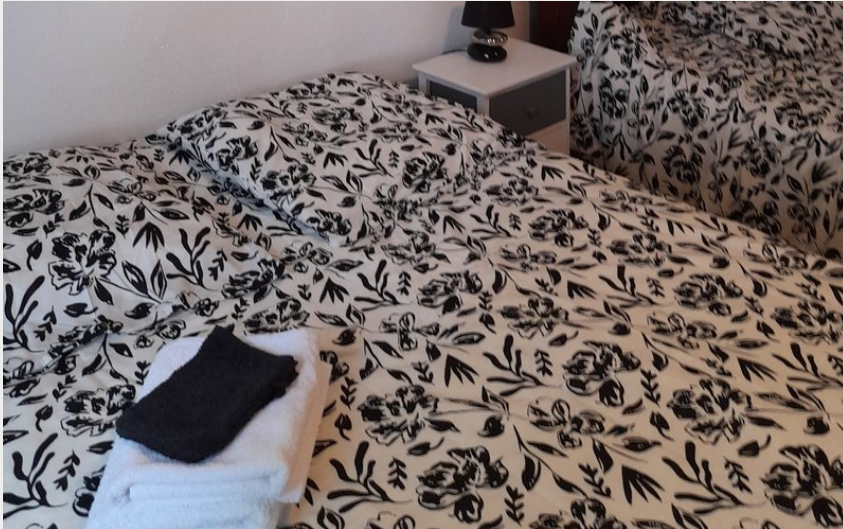
Crédit : Gîte de La Bourgarie, Les Vautours _ Chambre 2 (Gîte de La Bourgarie, Les Vautours)