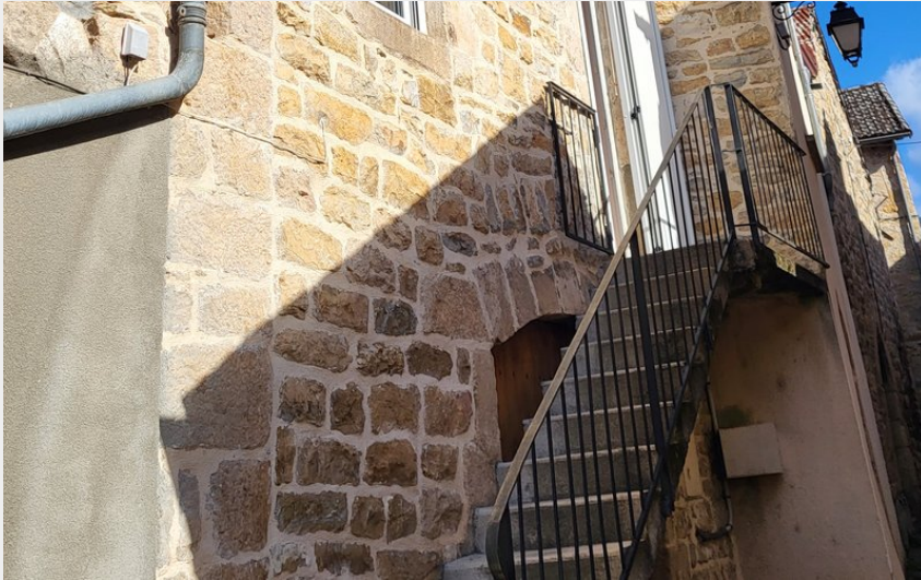
Crédit : Façade du Gîte "Chez Prémine" (Façade du Gîte "Chez Prémine")