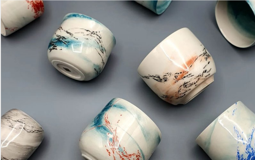
Ensemble de tasses colorées en faïence