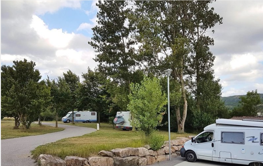
Crédit : Aire de camping-cars de Sainte-Eulalie de Cernon (Thierry CADENET)