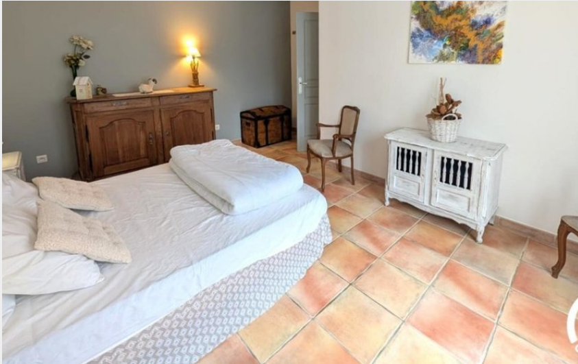
34G31706 - La Vie en Rose_5