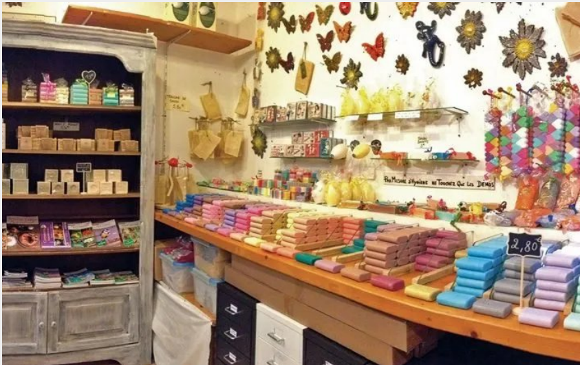
L'Orée du bois et la savonnerie