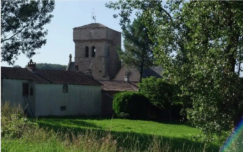
Crédit : TOUR HOSPITALIERE ET TOMBEAU DU COMMANDEUR (ROQUEFORT TOURISME)