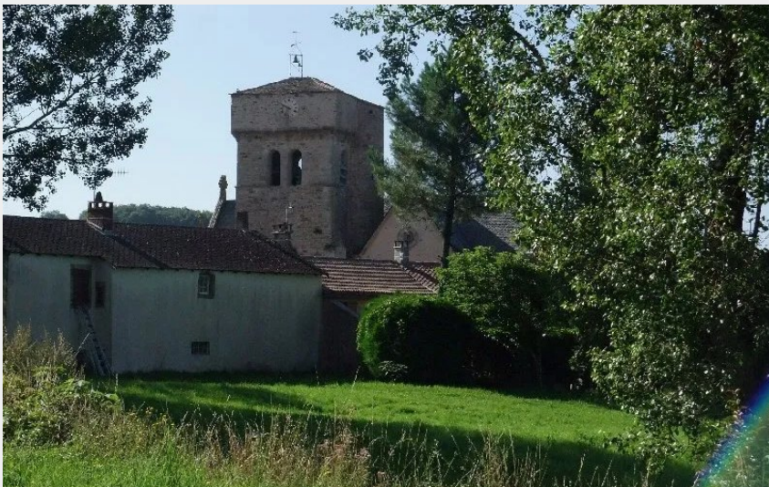
Crédit : TOUR HOSPITALIERE ET TOMBEAU DU COMMANDEUR (ROQUEFORT TOURISME)