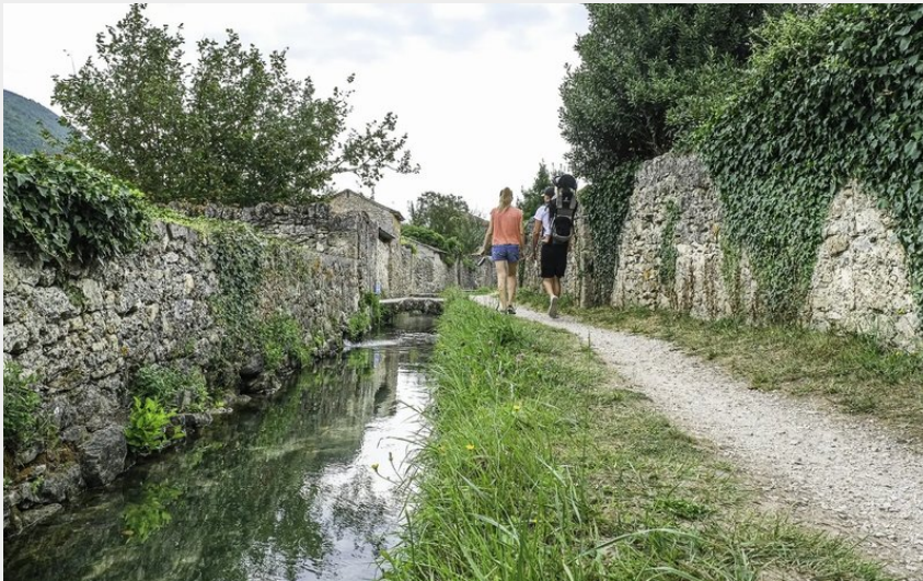
Visite commentée du chemin de l'eau