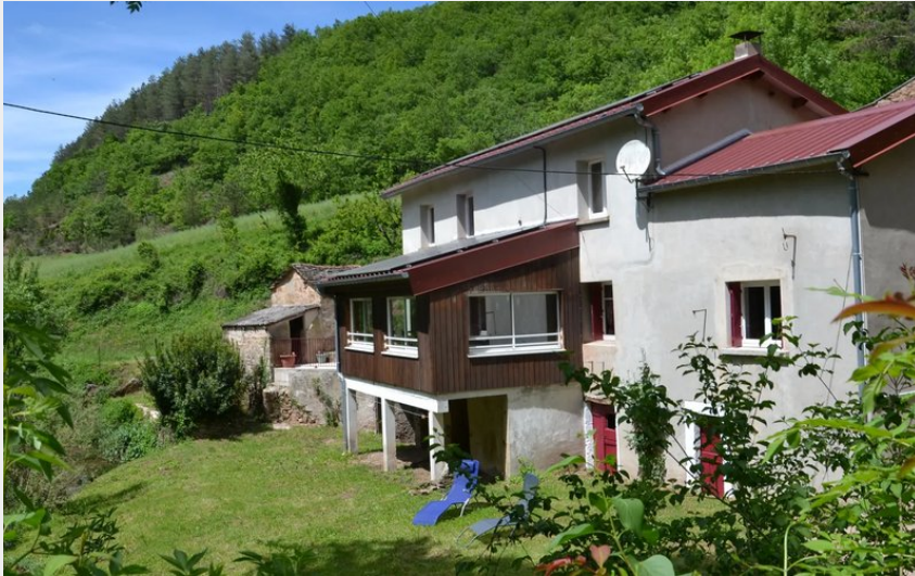
Crédit : Le moulin de Gissac dans son écrin de verdure (Nicole Reverdy)