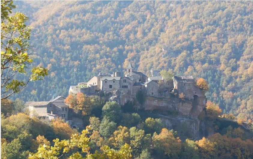
Crédit : Cantobre depuis la route de Trèves dans la vallée du Trévezel (Chez Yves)