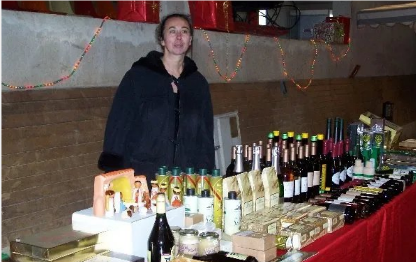
Crédit : Les produits des monastères (OFFICE DE TOURISME LARZAC TEMPLIER CAUSSES ET VALLEES)