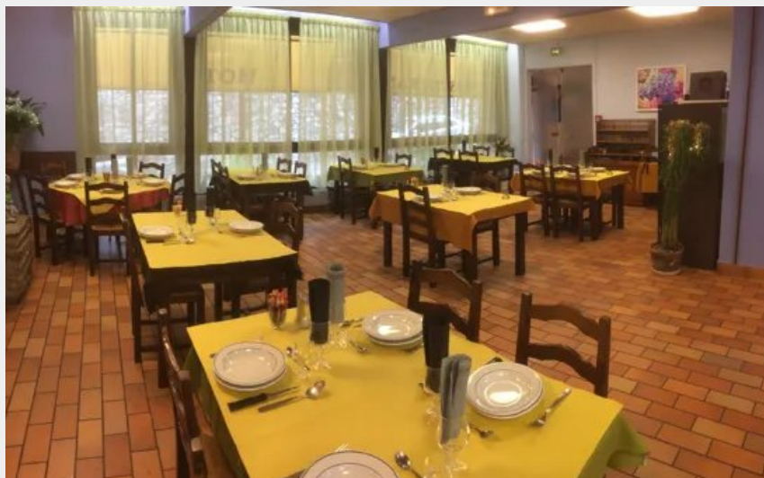
Crédit : salle de restaurant - Hôtel l'Agapanthe (Hôtel l'Agapanthe)