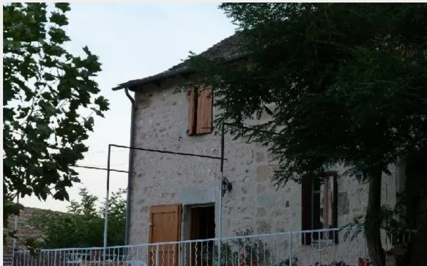
Gîte des Puechs - Entrée gîte