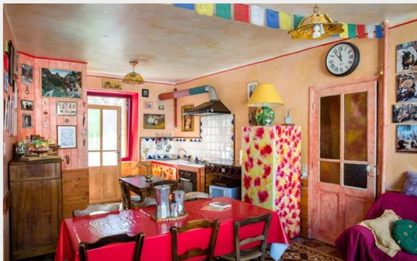
Crédit : Niveau 2 : la salle commune colorée et animée (Gîte La Jeanne)