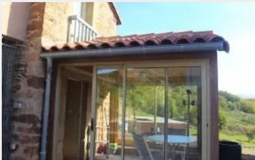
Crédit : Hameau de Bouyssi : Studio L'Oustalet (ROQUEFORT TOURISME)