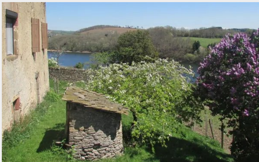
Crédit : Anne Loubière - location à Pont de Salars (Anne Loubière - location à Pont de Salars)