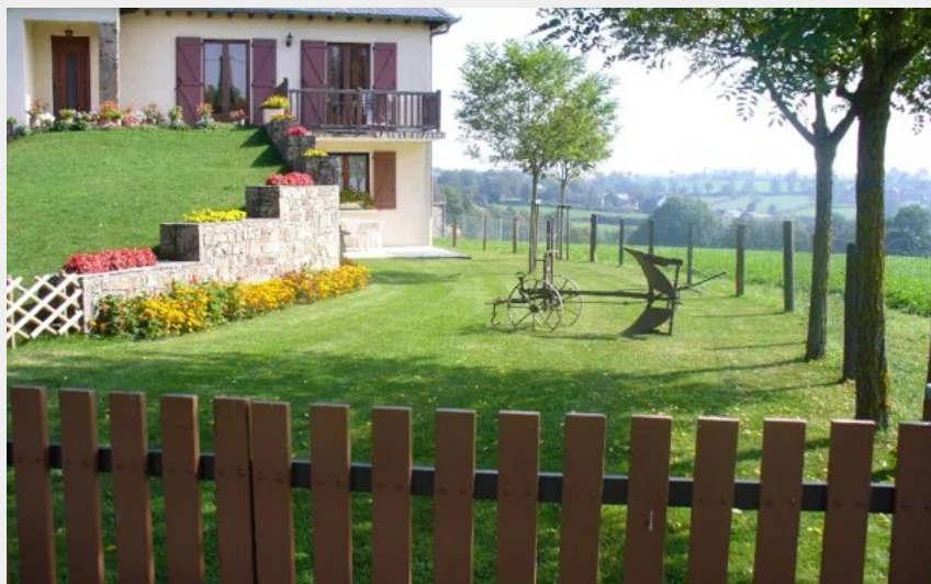
Crédit : Location Mme Guitard à Comps - jardin clos (Mme Guitard à Comps)