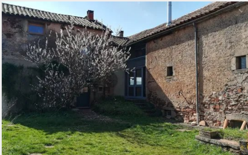
Crédit : Gîtes de Faragous - Moyen Gîte (Gîte de Faragous (groupes))