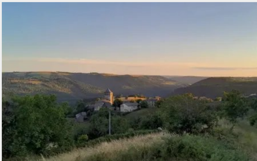
Crédit : Gîtes La bergerie de Lavernhe (OFFICE DE TOURISME DU REQUISTANAIS)